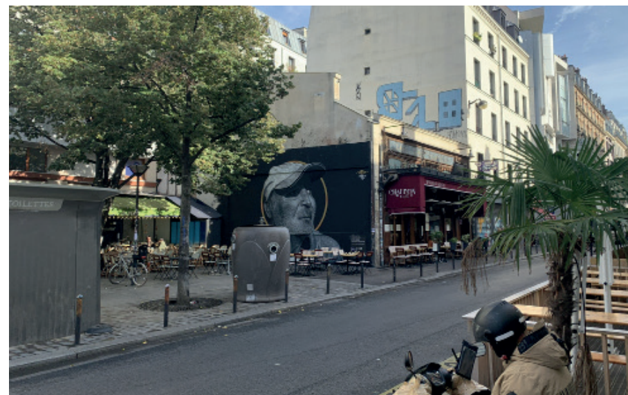
« Laurent »

Octobre 2021 / Le MUR d'Oberkampf, Paris