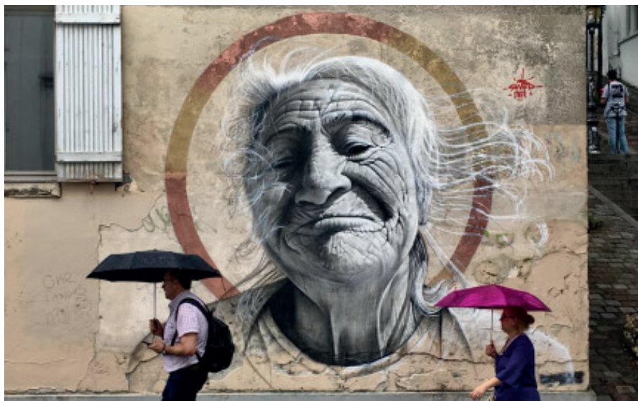
« La bonne aventure »