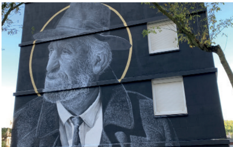
« Abraham »

Octobre 2021 / Le MUR d'Oberkampf, Paris