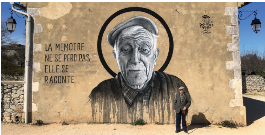
« La mémoire ne se perd pas, elle se raconte » Mars 2018 / Lussan