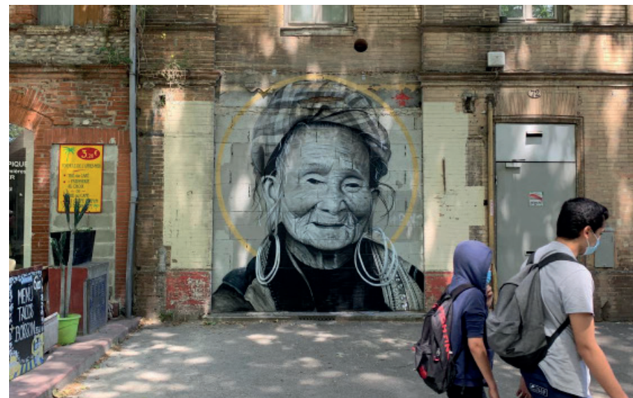
« Souvenir du Nord Vietnam »

Septembre 2020 / Paris 18ème arrondissement