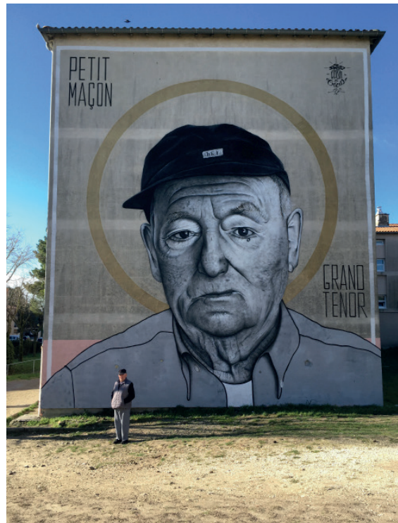
« Petit maçon, grand tenor » Mars 2018 / Uzès