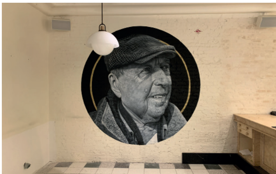
« Charly »

Juillet 2022 / Festival Arts de rue de Mazaugues