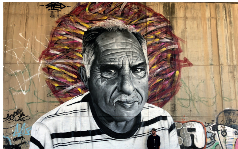
« Emilio » en collaboration avec Hopare

Juin 2018 / Festival Loures Arte Publica à Lisbonne