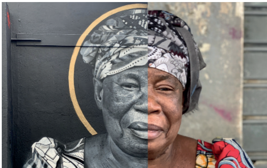
« Mama »

Septembre 2020 / Paris 18ème arrondissement