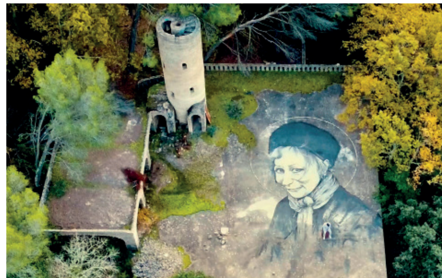
« Ephéméride »