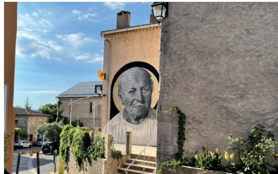
« Claude »

Octobre 2022 / Station Opéra avec la RATP