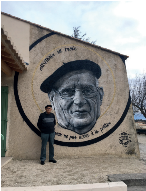
« Entretenir sa croix pour ne pas avoir à la porter » Mars 2018 / Baron