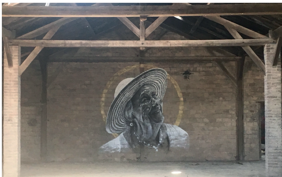
« Beauté intemporelle »

Juin 2018 / Festival Loures Arte Publica à Lisbonne