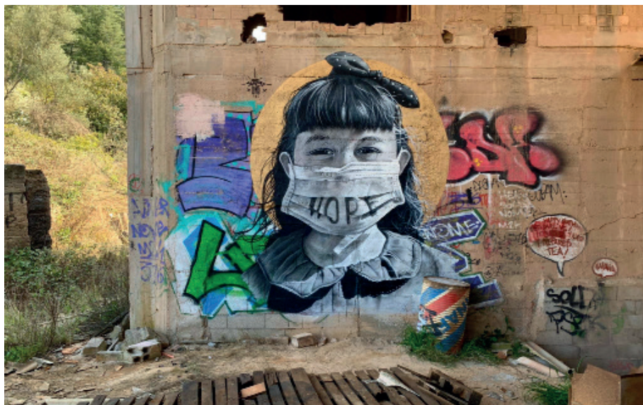
« Enfant du destin »